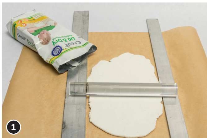
1. Een ca. 10 mm dikke plaat van de klei rollen.